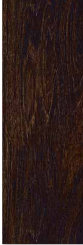
BAURE PEI 2 | Piso - Pared