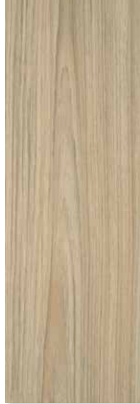
CHIQUITANO BEIGE PEI 3 | Piso - Pared