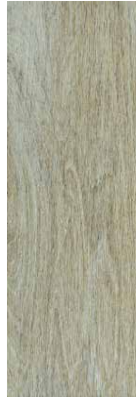
AYOREO PEI 3 | Piso - Pared