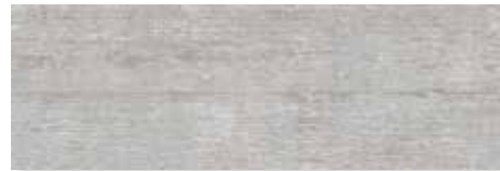
MALAYO GRIS 4 caras | PEI 4 | Piso - Pared