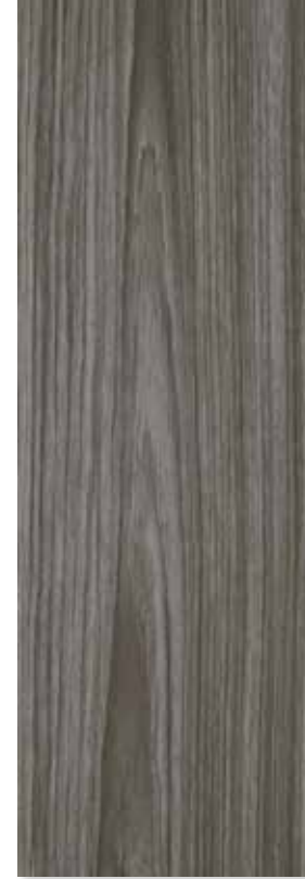
CHIQUITANO GRIS PEI 3 | Piso - Pared