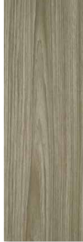
CHIQUITANO CENIZO PEI 3 | Piso - Pared