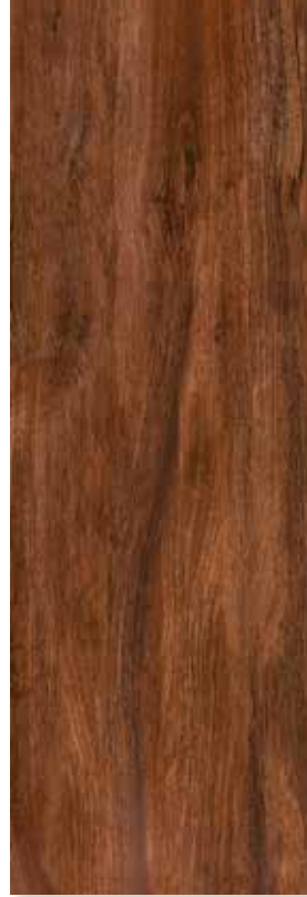
ARAONA PEI 3 | Piso - Pared