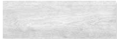
ERUCAPE 4 caras | Piso - Pared