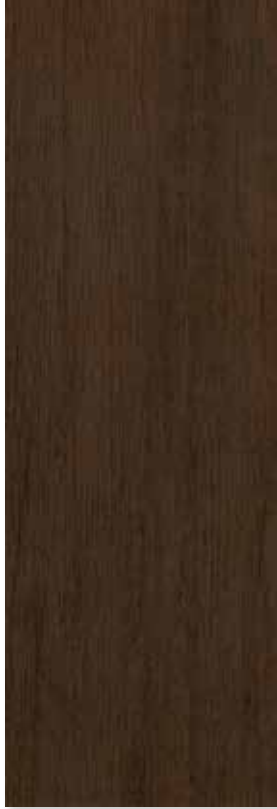
WENGUE PEI 1 | Piso - Pared