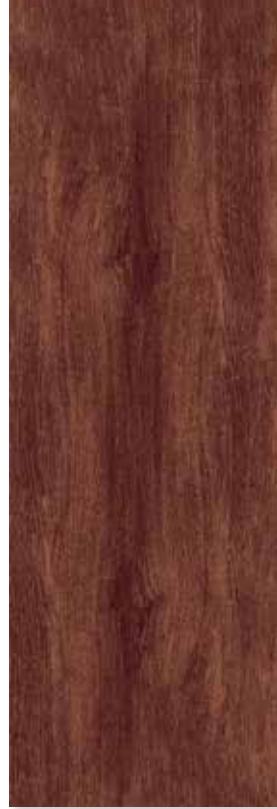
CASTAÑO PEI 3 | Piso - Pared