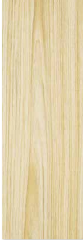
YURACARE PEI 4 | Piso - Pared