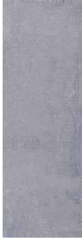
MALAYO GRIS PEI 4 | Piso - Pared