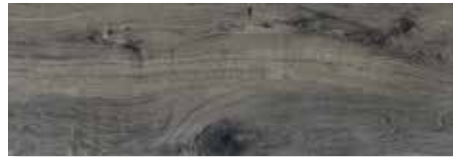
YUCALI 4 caras | Piso - Pared