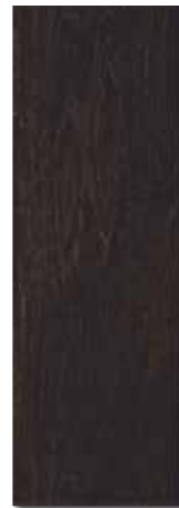
BAURE PEI - 2 / Mate Piso - Pared / 1 cara