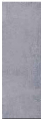
CIMENTO PEI - 3 / Mate Piso - Pared / 1 cara