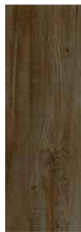
HEROS PEI - 3 / Mate Piso - Pared / 1 cara