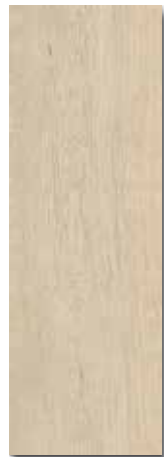
ARES BEIGE PEI - 4 / Brillo Piso - Pared / 1 cara