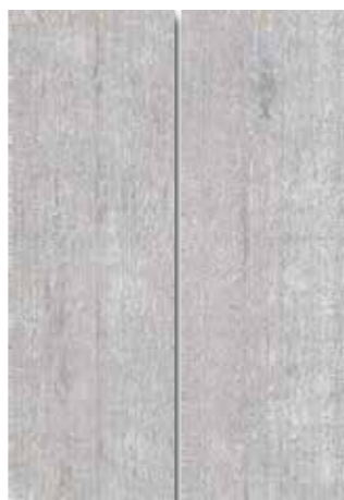
MALAYO GRIS PEI - 4 / Mate Piso - Pared / 2 cara