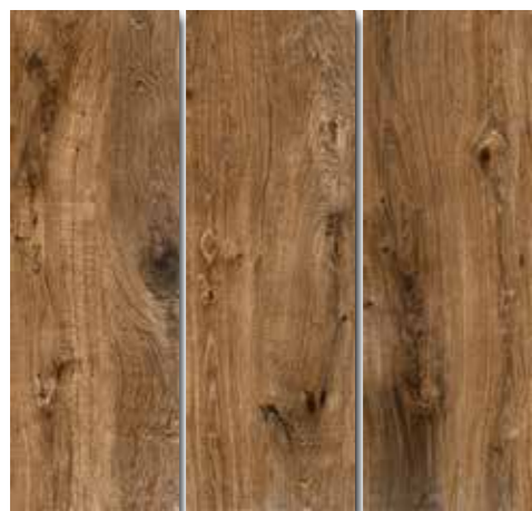
GUARANI PEI - 3 / Mate Piso - Pared / 3 cara