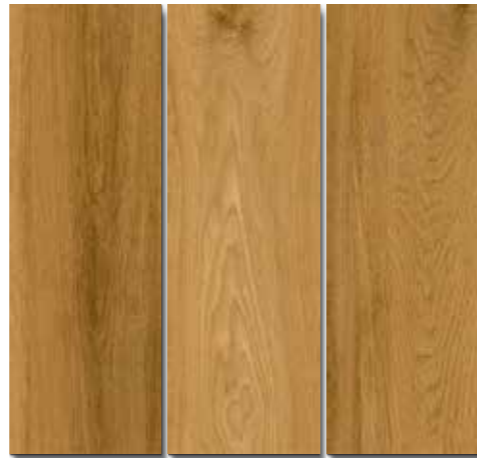
CAVINEÑO PEI - 3 / Mate Piso - Pared / 3 cara