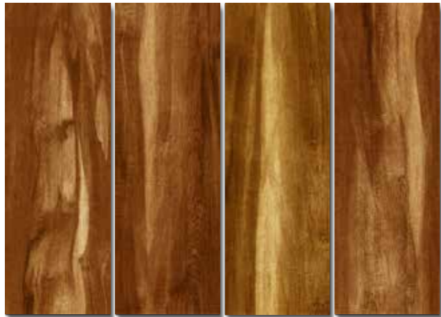
CANICHANA PEI - 3 / Mate Piso - Pared / 4 cara