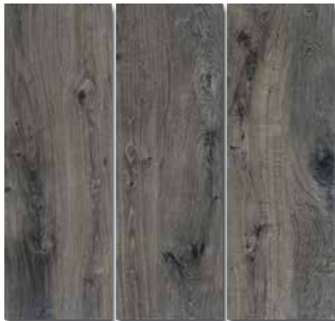
YUCALI PEI - 3 / Mate Piso - Pared / 3 cara