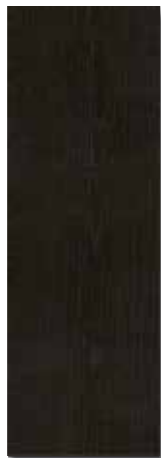
CRONOS PEI - 1 / Mate Piso - Pared / 1 cara