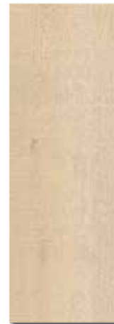
ATENEA PEI - 4 / Brillo Piso - Pared / 1 cara