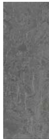
GARDEL PEI - 3 / Mate Piso - Pared / 1 cara