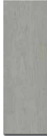
ARES GRIS PEI - 3 / Brillo Piso - Pared / 1 cara