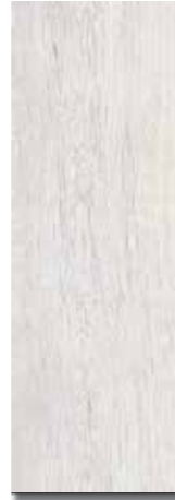
ARES PEI - 4 / Brillo Piso - Pared / 1 cara