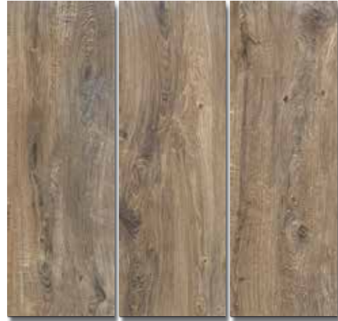
ARAUCANO PEI - 3 / Mate Piso - Pared / 3 cara