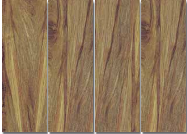
MOSETEN PEI - 3 / Mate Piso - Pared / 4 cara