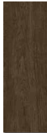
ARTEMISA MARRÓN PEI - 2 / Brillo Piso - Pared / 1 cara