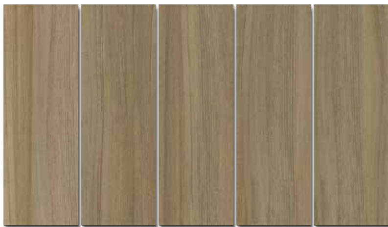
CHACOBO MARRÓN PEI - 3 / Mate Piso - Pared / 5 cara