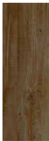
HEROS MARRÓN PEI - 3 / Mate Piso - Pared / 1 cara