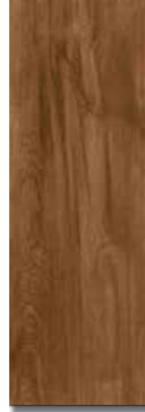
ROBLE PEI - 3 / Mate Piso - Pared / 1 cara