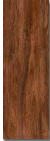
ARAONA PEI - 3 / Mate Piso - Pared / 1 cara