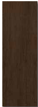
WENGUE PEI - 1 / Mate Piso - Pared / 1 cara