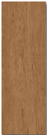
ARTEMISA PEI - 3 / Brillo Piso - Pared / 1 cara